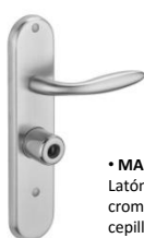
• MANILLA Latón pulido o cromado cepillado